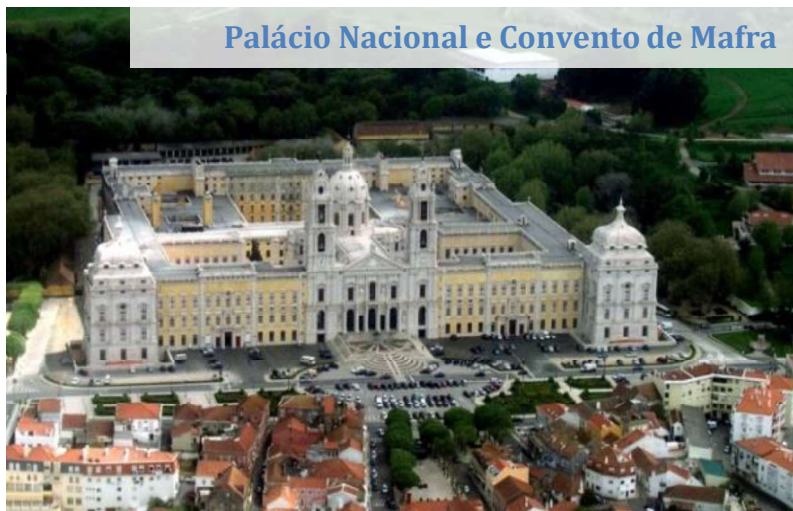
Palácio Nacional e Convento de Mafra

Depois da visita a Loures, seguimos para Mafra, que fica a 27 km. de distância. É um município próximo de Sintra, junto ao litoral, dentro da região de Lisboa. Com uma população de mais de 4.000 habitantes onde destaca o Palácio Nacional e Convento inscrito na UNESCO como Património Mundial (2019). Construído ao longo de mais de três décadas, o Real Edifício de Mafra tornou-se um epicentro de ensino e conhecimento, onde se formaram as seguintes gerações de engenheiros e arquitetos. Politicamente o Palácio-Convento deve ser visto como a manifestação concreta, mais representativa, do poder absoluto do monarca D. João V, enquanto afirmação terrena e divina da sua autoridade, tendo como principal objetivo projetar Portugal como potência internacional.